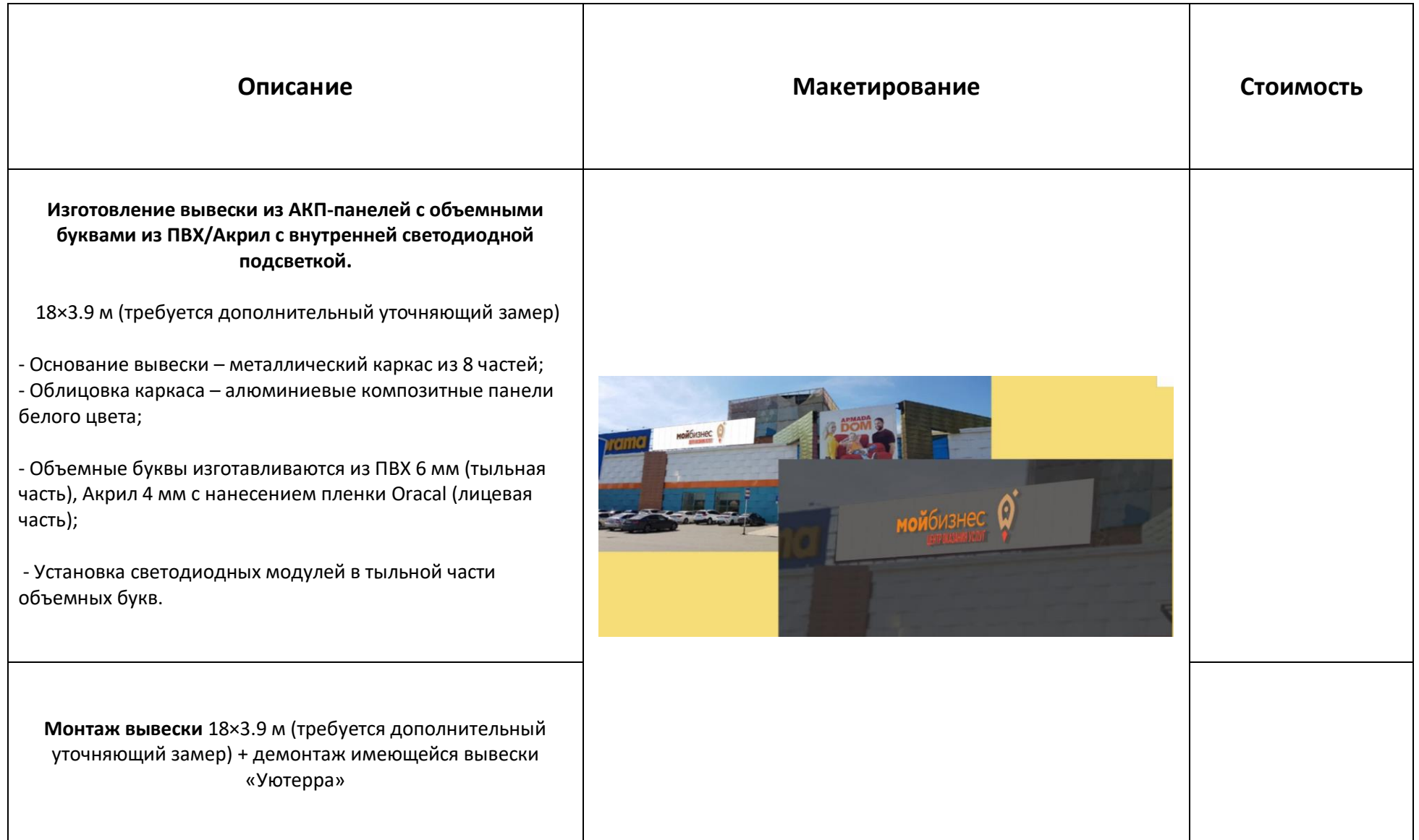
Таблица для заполнения коммерческих предложений